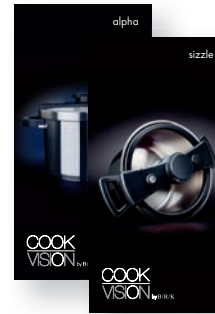
Broschüren für den Endverbraucher

Gerne stellen wir uns auf Ihre speziellen Wünsche ein. Lassen Sie uns gemeinsam ein auf Ihre Ziele angepasstes Vertriebskonzept entwickeln und kommen Sie mit uns ins Gespräch.