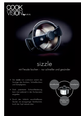
Poster, Anzeigen etc. in allen Formaten