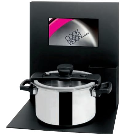
Hochwertiges Display mit Videomonitor